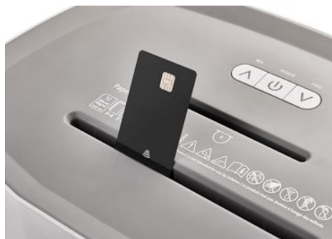
Skartovač DAHLE PaperSAFE® 240