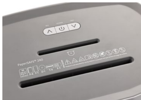
Skartovač DAHLE PaperSAFE® 240