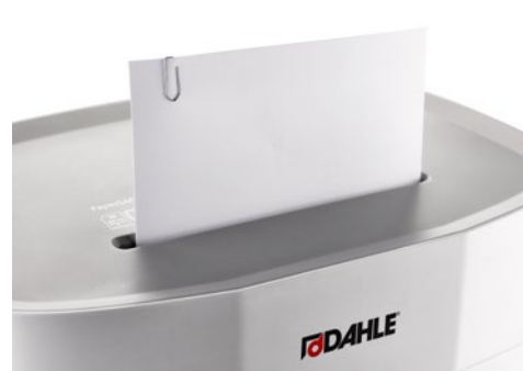
Skartovač DAHLE PaperSAFE® 240