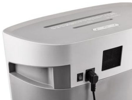
Skartovač DAHLE PaperSAFE® 240